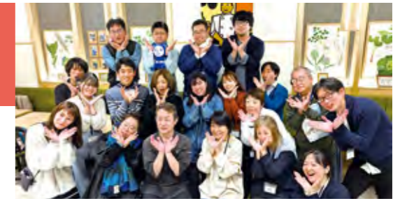
▲18区丼ナイトフェスティバル

https://dokohoru.base.shop/ https://www.instagram.com/tsubaki_shokudou https://www.facebook.com/tsubaki.ygc