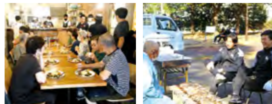
▲健康ランチ(神大喫茶)