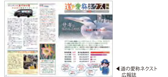
◀道の愛称ネクスト 広報誌