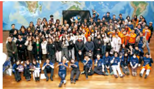
▲キャンドルナイトのメンバーによる集合写真