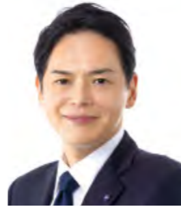
横浜市長 山中 竹春

横浜の魅力・にぎわいを高めてくださっている受賞者の皆様に厚く御礼申し上げますとともに、皆様の今後益々の御活躍を心より祈念しております。