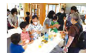
▲みんなで楽しむワークショップ