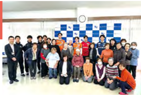
▲神奈川大学サッカー部出身者のリーグ加入内定の記者会見