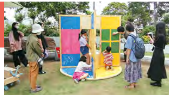
▲作品展示の様子(横浜市役所水辺プラザ)