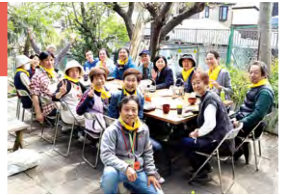
▲イベント後の交流の様子