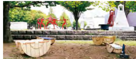
▲作品展示の様子(グランモール公園)