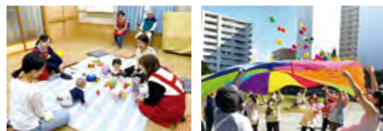
▲町内会館での様子