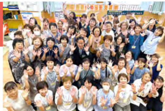
▲各子がめ代表スタッフ集合写真