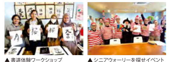
▲書道体験ワークショップ