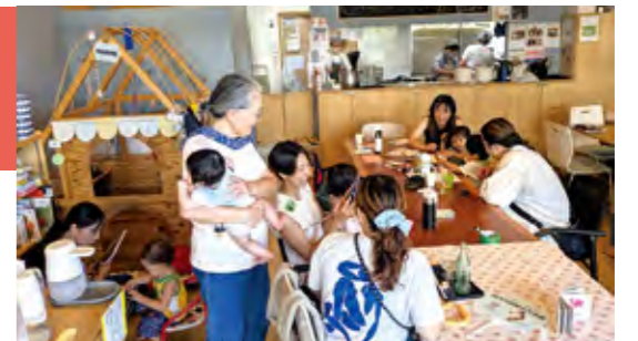
▲カフェの利用風景