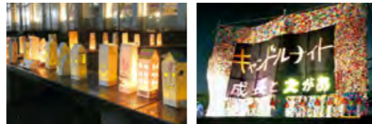
▲キャンドルホルダー点灯