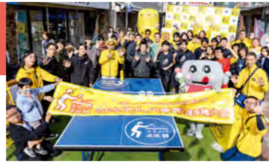
▲全かなスリッパ卓球選手権大会の様子